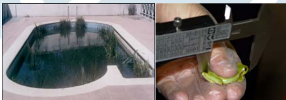
Figura 3 y 4. Piscina acondicionada para la ranita y medición de los ejemplares.

Los datos obtenidos se han incluido en tablas Excel para después ser tratadas estadísticamente con el programa Past. Se ha realizado una estadística descriptiva de los parámetros reproductores de la población, se ha analizado la fecundidad correlacionando esfuerzo reproductor y peso de la hembra con el tamaño de la puesta, y se ha corroborado mediante "t de Student" el dimorfismo sexual.