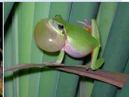
Figuras 7 y 8. Hembra de Hyla meridionalis a la izquierda y macho cantando a la derecha.