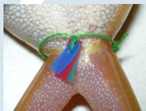
Figuras 1 y 2. Detalles del sistema de marcaje empleado en el estudio. Hilo verde+ azul-rojo-verde.

En 1998 se realizó un estudio preliminar sobre la población de ranita meridional que sentó las bases para el desarrollo del Plan de Gestión de la especie (catalogada "en peligro de extinción en la CAPV). Aquel "análisis de la situación" aportó información sobre las causas de su regresión, factores de amenaza, distribución, fenología o algunos parámetros poblacionales, entre otros. Desde entonces se viene realizando un seguimiento anual de la reproducción, lo cual ha permitido ampliar el conocimiento sobre su historia vital. Las ranitas acuden a las piscinas del entorno para reproducirse, lo que ha sido aprovechado para el manejo, habiendo facilitado el Plan de Reintroducción de la especie en Gipuzkoa. En 2003 se marcaron los reproductores que acudían a las piscinas de Berio (Donostia-San Sebastián), obteniéndose los datos sobre la biología reproductora de la ranita meridional de Mendizorrotz que ahora se presentan en este panel de manera preliminar.