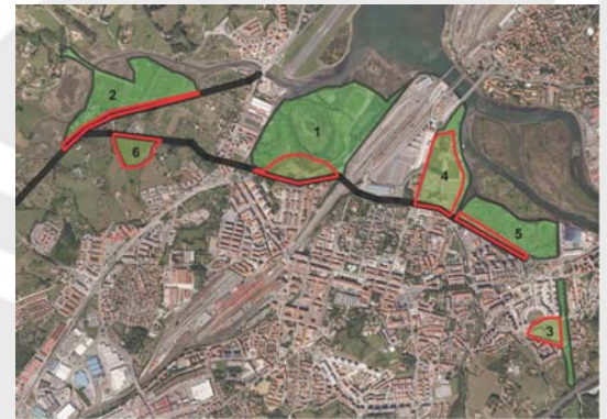
Figura 1. Distribución de la especie (trama en verde), ampliación de la red viaria (línea negra) y superficie afectada por las obras (entramado rojo).