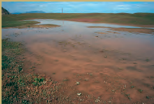
Hondartzan sortzen den sakonera gutxiko putzutxo hau, ugalketarako erabiltzen dute.