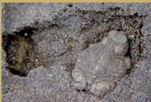
Hondartzako lurzoru hareatsuetan babes bila dabilzan bi apo.

Azkorriko apo lasterkariaren populazio bakarra hondartzako lurzoru bigun eta hareatsuetan aurkitzen da. Aurretiaz, espezieak hareatzaren inguruetako baratza eta larreak, hau da, lurzoru anderatuak erabiltzen zituen. Honen lekuko, golf zelaian aurkitutako zenbait apo dira. Ugalketarako, sakonera gutxiko putzu txikiak, ibilgailuek hondartzara jaisterakoan sortzen dituzten gurril-arrastoetan pilatutako putzutxoak eta hareatzeko atzealdean azaleratzen diren ur-pilaketak erabiltzen dituzte.