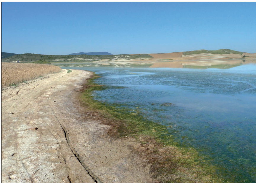
Fig. 1.- Población de R. drepanensis en la balsa de Zolina-Ezkoriz.