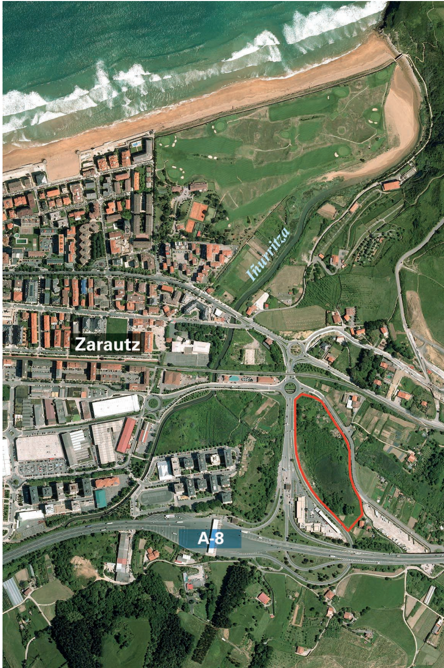
Fig. 1.- Carrizal de Asti (área en rojo) en Zarautz. La regata de Iñurritza se sitúa al norte. Fig. 1.- Asti reedbed (red) in Zarautz. The Iñurritza stream is situated in the north.