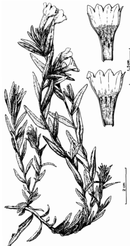
Figura 1.— A: Lithodora prostrata . A 1, hábito; A 2, flor abierta. B: Lithodora diffusa . B 1, flor abierta.

Si nos centramos en la zona cantábrica, en el occidente de Asturias vive desde el eje de la Cordillera hasta el nivel del mar. A medida que avanzamos hacia el este, L. prostrata queda restringida a las zonas más próximas a la costa. Los valles interiores, protegidos por pequeñas cadenas montañosas de la influencia oceánica, parecen ser una barrera para esta especie que continúa por toda la comarca litoral hasta el País Vasco, donde tampoco se aventura en exceso hacia el interior.