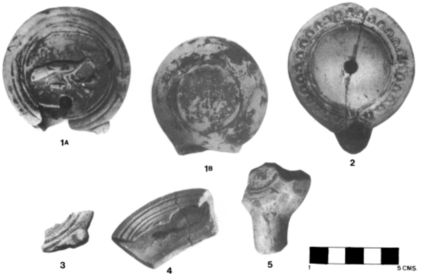
Lámina 1 : 1-2: ejemplares de las minas de Arditurri; 3-5: ejemplares de Santa María del Juncal.