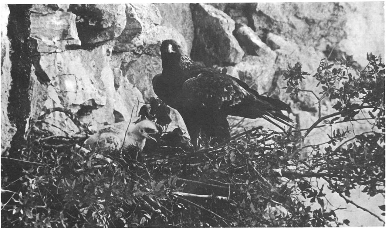
Foto 2. Nido de águila real. Macho junto al pollo de 30 días