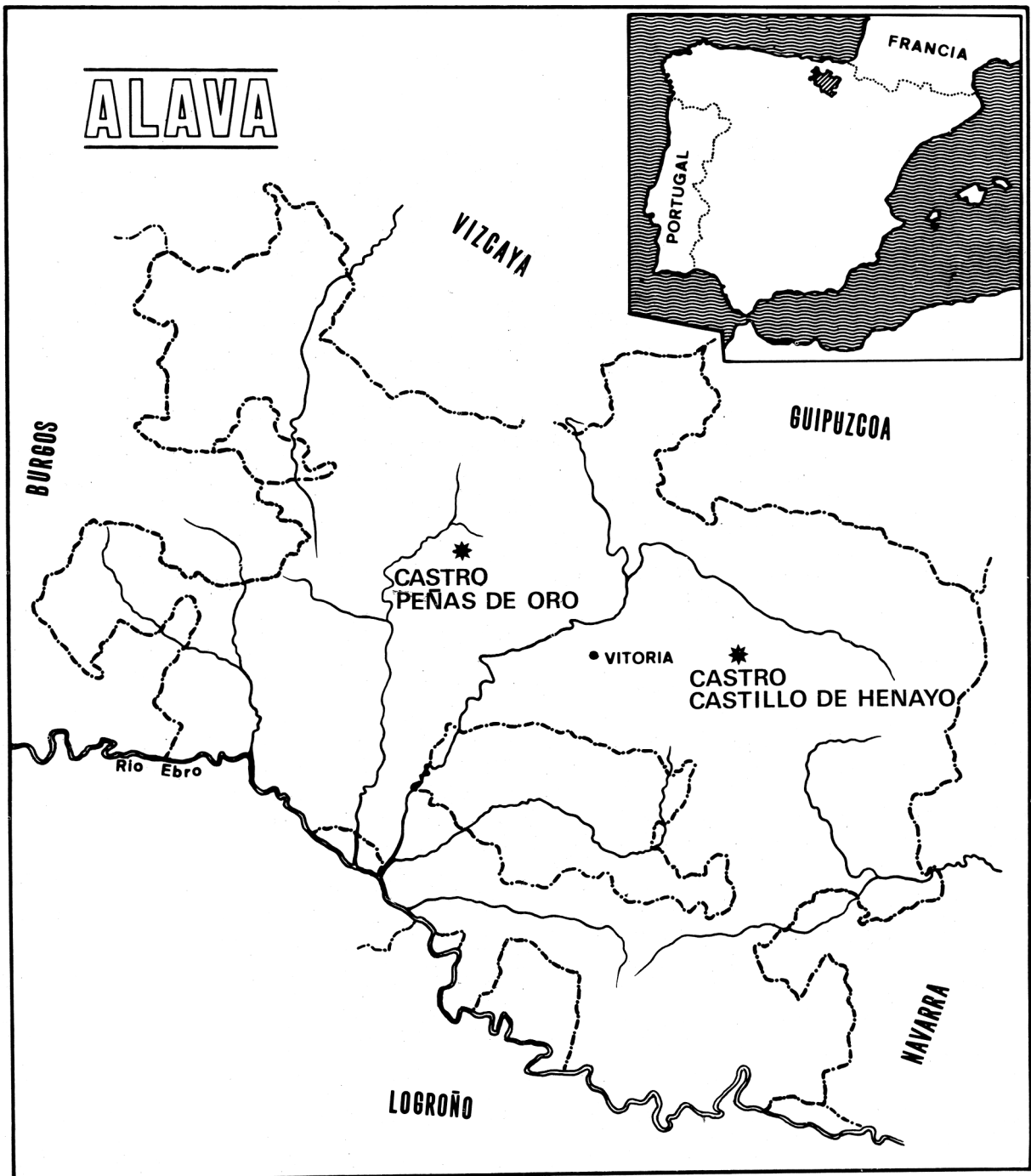
Fig. 1. Plano de situación de los yacimientos «Castro Peñas de Oro» y «Castro Castillo de Henayo».

calizaron en el Castro de las Peñas de Oro. A este primer hallazgo siguen los encontrados en el Castro de Castillo de Henayo, aún en proceso de excavación (figura 1).