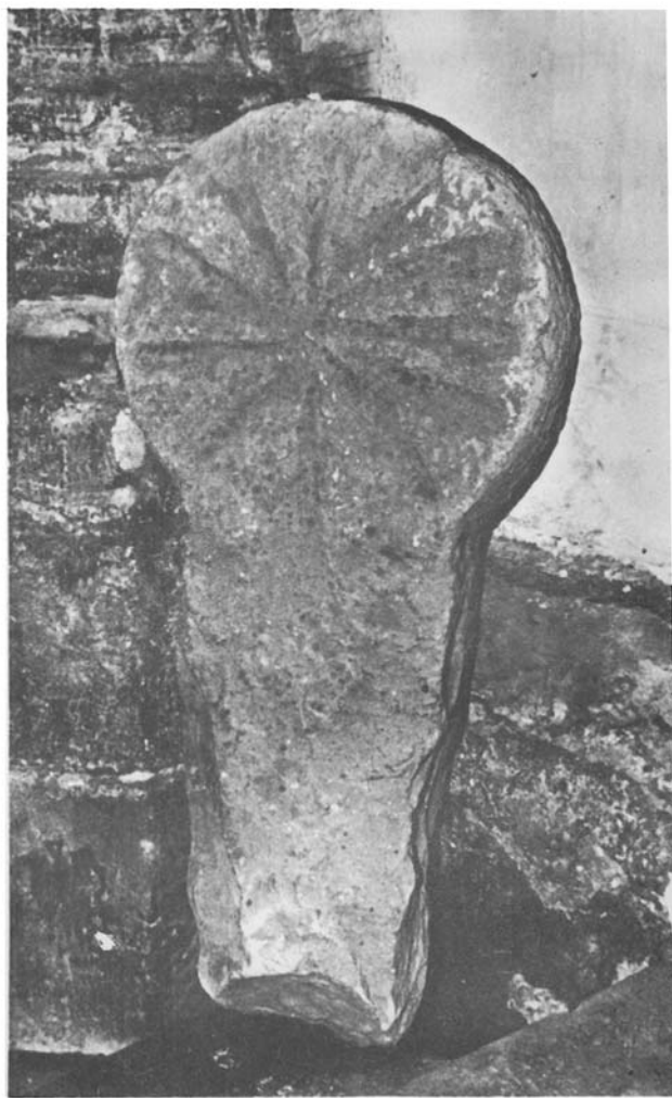
Fot. 2. Estela de Segura. Cara posterior.