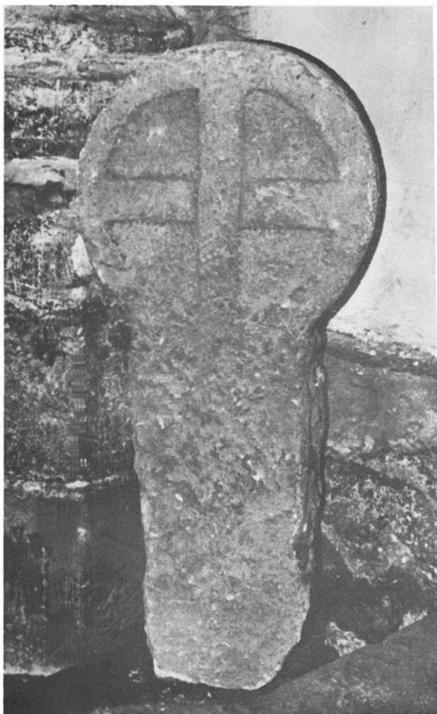
Fot. 1. Estela de Segura. Cara anterior.