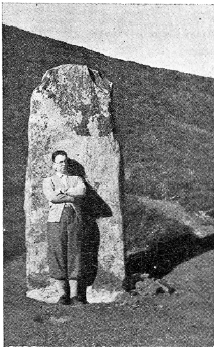
«Menhir» de ELAZMUÑO (Ezcurra)

En el año 1928 —febrero— en uno de mis paseos de caza, por los parajes de Ezkain, estuve examinando la circunferencia de piedras que señalo con el núm. 10 de los cromlecs: pensé en restos de alguna cabaña, de algún redil... y no supe lo que podría significar. Varios años más tarde (1935) una conversación con D. Bonifacio Echegaray sobre el tema, me hizo sospechar fuesen "cromlecs". Hice una visita a Ezcain, y encontré los catorce cromlecs (mejor trece enteros y uno destruido) que señalo en el plano.